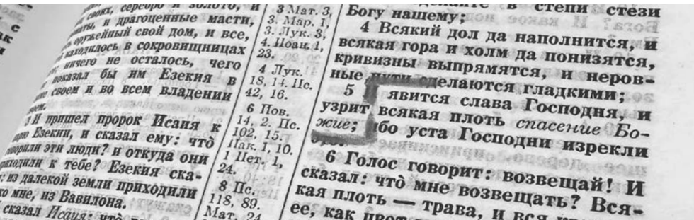
пример «Ис. 40:5 явится (до Божие)» отмеченную в Библии

Начинайте изучение Библейского Урока с первой цитаты из Библии в разделе 1. Прочтите все цитаты из Библии в этом разделе, а затем прочитайте цитаты из «Науки и здоровья» в том же разделе. Продолжайте читать каждый последующий раздел, чередуя эти две книги.